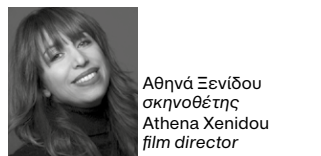
Αθηνά Ξενίδου σκηνοθέτης Athena Xenidou film director