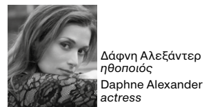
Δάφνη Αλεξάντερ ηθοποιός Daphne Alexander actress