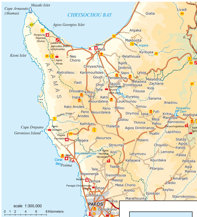
Prepared by Lands and Surveys Department, Ministry of Interior, Kypros 2015.

Пафос - Эмба - Лемба - Киссонерга - Корал Бэй - Маа Палзокастро - Ущелье Авакас - Лара Бэй - Пегея - Катикас Акурдалия - Като и Пано Ародес - Инейя - Друсия - Фасли - Андролику - Нео Хорио - Лачи - Купальня Афродиты - Полис Хрисоху - Скули - Холи - Милью - Гиолу - Струмби - Цада - Монастырь Агиос Неофитос - Месоги - Пафос