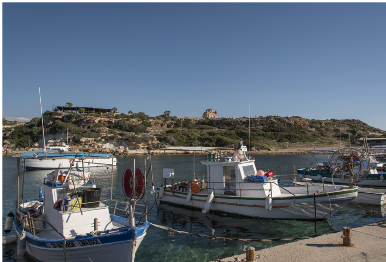
Рыбацкий причал. Пэйа.

Продолжайте свое путешествие, вновь вернувшись на главную дорогу, и проехав мимо чудного Зоопарка Пафоса. Далее, наш маршрут предлагает вам подняться выше, чтобы добраться до Пейи, которая находится в 15 км к северу от Пафоса и расположена