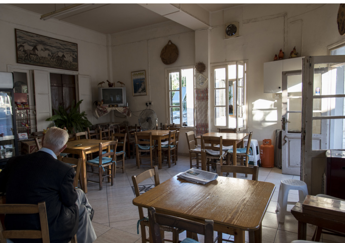
Местная кофейня. Деревня Цада.

Благодаря далеко идущим горным хребтам и долинам, Милью предлагает идеальные условия для длительных пеших прогулок по сельской местности и идеально подходит для наблюдения за птицами, поскольку деревня служит местом гнездования соловьёв. Двигайтесь медленно вниз по холму, чтобы выехать из Милью, и пройдите прямо по главной дороге, чтобы проехать мимо Йолу. Если вам хочется сделать небольшую остановку, то деревня, которая стоит на краю долины на высоте 368 метров над уровнем моря, предложит вам прекрасный вид на холмы, повсеместно увитые виноградными лозами и украшенные цитрусовыми рощами.