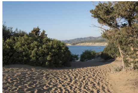
Лара Бэй Акамас

Менее физически-требовательный маршрут, но столь же захватывающий, можно преодолеть лишь в нескольких километрах от ущелья - в заливе Лара. Это один из лучших пляжей, которые вы можете только встретить на острове.