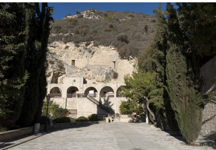
Монастырь Агиос Неофитос

Покидая территорию монастыря, вернитесь на главную дорогу, по которой вы уже ехали и, повернув налево, вы проедете через деревню Цада, родную деревню национального героя ЕОКА - Эвагораса Палликаридиса. Дальше, вы сможете посетить маленькую деревушку Каллепелия,