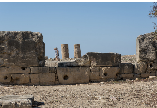
Палэпафос (Старый Пафос)

Известным фактом является то, что найденная тут уникальная кипрская статуя фертильности (плодородия) обрела свой новый свой дом в частной коллекции музея Дж. Пола Гетти в Калифорнии.