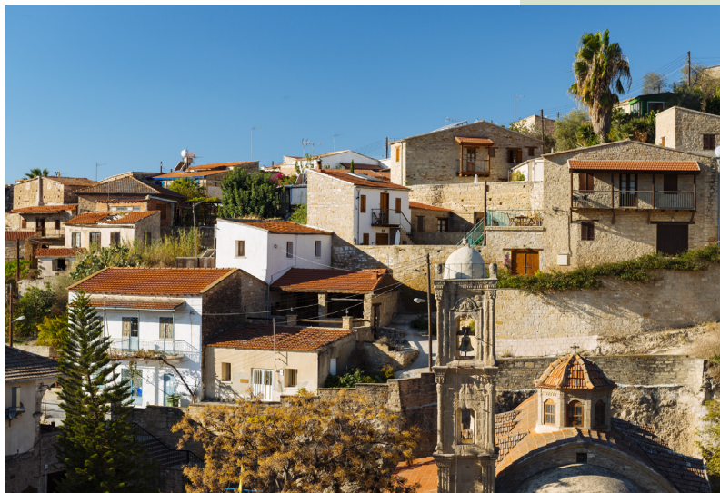
Тохни - одна из самых старых деревень на острове. Ларнака.

Многогранный Кипр, с его суровыми берегами и лазурными пляжами, горными вершинами и плодородными долинами, солнечными виноградниками и прохладными сосновыми лесами, просторами пшеничных полей и пышными цитрусовыми садами, может предложить каждому гостю нечто особенное, что согреет его душу и покорит сердце.