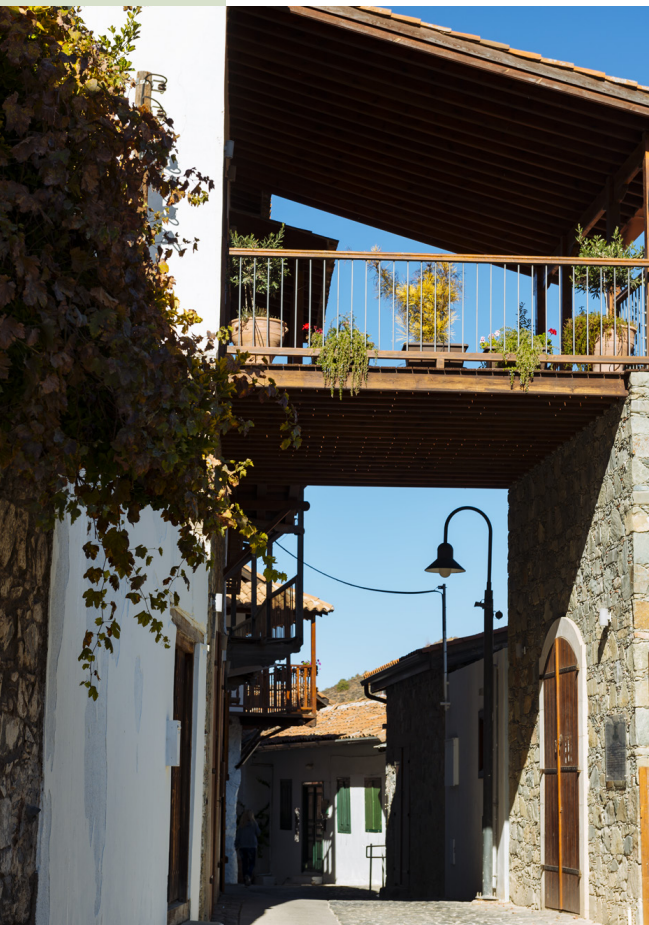
Деревня Калопанайотис. Никосия.

Утром вас разбудит задорный петушинный клоч или утренняя ослиная пронзительная ария. Потом вам предложат деревенский завтрак в тенистой прохладе, под густыми листьями лозы. Насладитесь свежим сельским воздухом, густо наполненным запахом жасмина, лаванды или дикого тимьяна. Затем вы можете отправиться на прогулку или по сосновому лесу, или по пешеходной натуральной тропе. В сёлах, вы можете посмотреть, как пекут местный хлеб и делают знаменитый сыр «халуми» и почувствовать ритм и колорит реальной сельской жизни. А на закате, когда жаркое солнце закатывается за величавые горы, просто откиньтесь в удобном кресле, наслаждаясь волшебным кипрским вечером, глядя на одно из самых звездных небес, которое вы когда-либо увидите, убаюканное нежными звуками ночных сверчков.