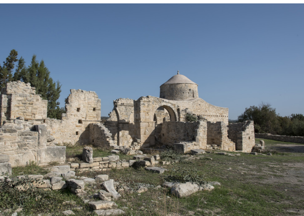
Тимиос Ставрос, Аногира

По дороге в Аногиру, вы встретите руины византийского монастыря Тимиос Ставрос (Святой Крест) с красивыми и хорошо сохранившимися фресками. Деревня Аногира особенно известна тем, что сохраняет традиционный способ изготовления «Пастелли» - популярного сладкого какао из плодов рожкового дерева. Ежегодно, в сентябре, тут проводится фестиваль Пастелли.