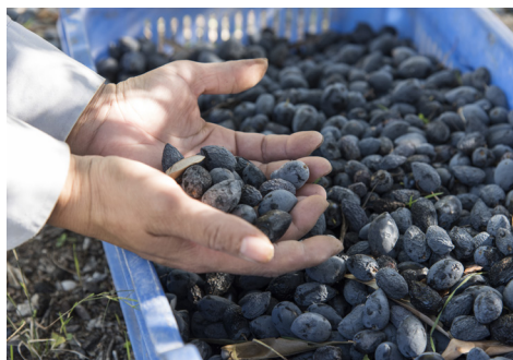
Сбор оливок. Канту.

Двигаясь дальше на юг, мимо плотины Курис, вы доберётесь до деревни