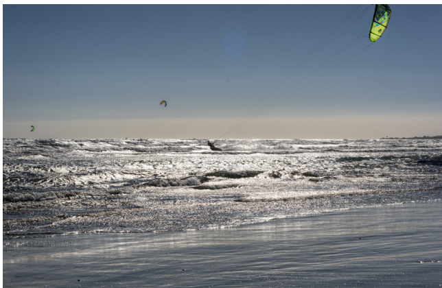
Пляж Ледис Майл