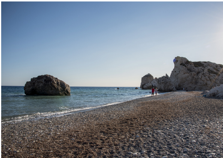
Петра ту Ромиу

Всего в нескольких километрах дальше по дороге, вы проезжаете по одной из самых красивых береговых линий острова, где величественно лежит огромный валун - Петра ту Ромиу. Это поразительное по своей структуре и красоте геологическое образование больших и высоких скал, более известное как