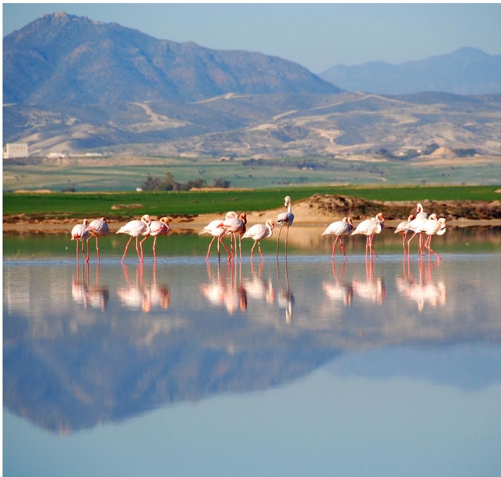
Соленое озеро. Ларнака.

Мечеть Халасултан Текке. Построена в 1816 году и расположена на западной окраине соленого озера Ларнаки, благородно возвышаясь в окружении красивых стройных пальм, она является одной из самых важных мусульманских мест паломничества в мире.