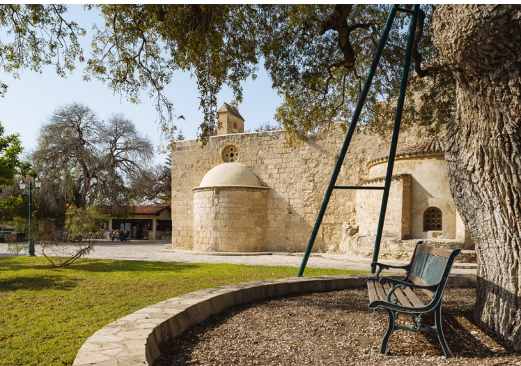
Кити Панагия Ангелоктисти.

Продолжайте свой путь в Марони, в деревню, которая своими корнями уходит к позднему бронзовому веку. С её отреставрированными традиционными старыми особняками и каменными аллеями. Этот пункт назначения служит прекрасным примером архитектуры кипрской низменности, сохранившейся до наших дней. Деревня и окружающая её долина идеально подходят для производства овощей, выращенных как на открытом воздухе, так и в теплицах,