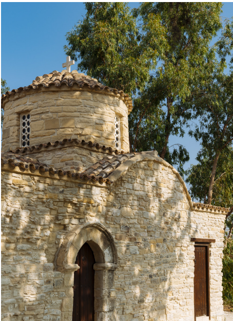
Агиос Мамас Аламинос

Продолжайте ваше движение в Марони, деревню со старинными самобытными особняками и мощеными улицами, чье происхождение восходит к бронзовому веку.