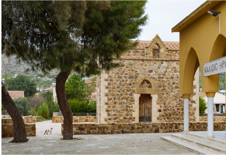
Пига. Царская капелла.

Интересным окажется и визит в церковь Панагии Хриселеуса, с ее впечатляющими фресками. Ещё продолжаются раскопки в археологическом месте Асиену-Маллораситэ, в котором охватываются геометрические, архаические, классические, эллинистические, римские, византийские, франкские, венецианские и османские периоды истории острова. Полностью отреставрирована мукомольная фабрика Андреаса Хаджифеохароса, работающая ещё с 1910 года, на которой посетителям предлагают ознакомиться с традициями сельской жизни на Кипре.