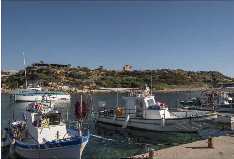
Port de pêche de Pegeia

Moins physique, mais tout aussi magnifique à découvrir, est la baie de Lara à quelques kilomètres des gorges. C'est l'une des plus belles plages de toute l'île, en même temps qu'un sanctuaire pour les tortues marines vertes ( Chelonia mydas ) et Caretta caretta .