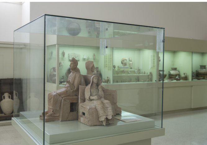
Musée de Polis

Traversez Pano et Kato Arodes pour arriver à Ineia, l'un des rares villages à perpétuer l'artisanat de la vannerie. Découvrez cet artisanat au musée local du panier qui présente toutes sortes de paniers, de toutes tailles et pour tous usages, mais aussi comme décorations murales, nasses pour la pêche et bien d'autres choses encore.