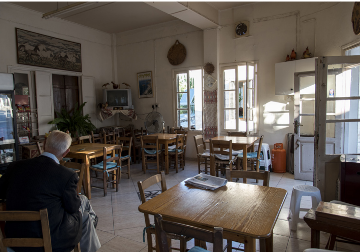
Café local de Tsada

Avec une vue d'ensemble sur la montagne, les vallées et une campagne paisible, Miliou est le lieu idéal pour de longues randonnées et l'observation des oiseaux, le village étant un site de reproduction pour les rossignols. Redescendez lentement de Miliou et prenez à droite sur la route principale pour rejoindre Gioliou. Situé sur les hauteurs de la vallée à 368 m d'altitude, le village offre de belles vues sur les pentes des collines couvertes de vignes et de citronniers.