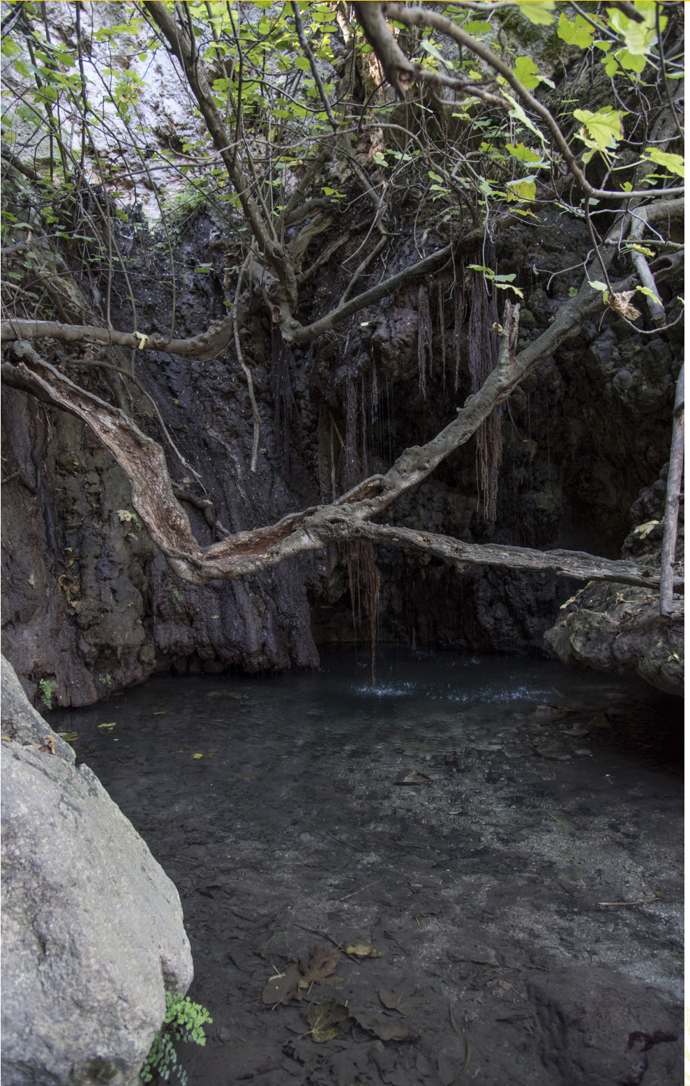
The Baths of Aphrodite