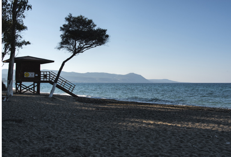
Camping de Polis

Quittant Skoulli, prenez à droite sur la route principale pour arriver à Akourdelia, puis Miliou. Ce ravissant village traditionnel est entouré de champs de citronniers, d'amandiers, de vignes et d'une flore abondante grâce à