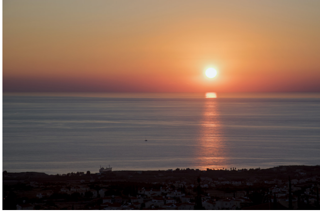
Agios Georgios Pegias

Poursuivez sur la route côtière principale jusqu'à la plage de galets tranquille et le petit port de pêcheurs d'Agios Georgios, où vous pouvez aussi casser la croûte dans les restaurants au-dessus du port. Le lieu est connu pour ses spectaculaires couchers de soleil à la fin du printemps et au début de l'hiver avec ses nuances rouge et ambre colorant la péninsule d'Akamas.