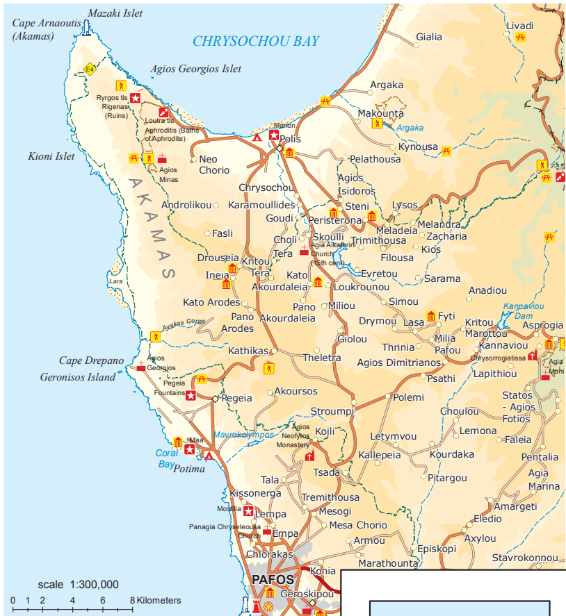
Prepared by Lands and Surveys Department, Ministry of Interior, Kypros 2015.

Pafos – Emba – Lemba – Kissonera – Coral Bay – Maa Paliokastro – Gorges d’Avakas – Lara Bay – Pegeia – Kathikas – Akourdaleia – Kato et Pano Arodes – Ineia – Drouseia – Fasli – Androlikou – Neo Chorio – Latsi – Bains d’Aphrodite – Polis – Chrysochou – Skoulli – Choli – Miliou – Giolou – Stroumpi – Tsada – Monastère d’Agios Neofytos – Mesogi – Pafos