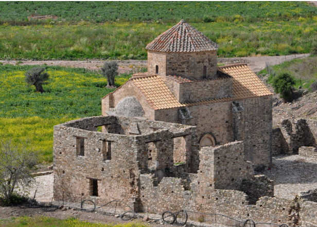
Panagia tou Sinti Pentalia

Reprendre la route en sens inverse, avant de tourner à gauche, via le village de Pentalia et par une route de terre sinueuse, vers le monastère de la Panagia tou Sinti, l'un des plus imposants édifices de l'époque vénitienne,