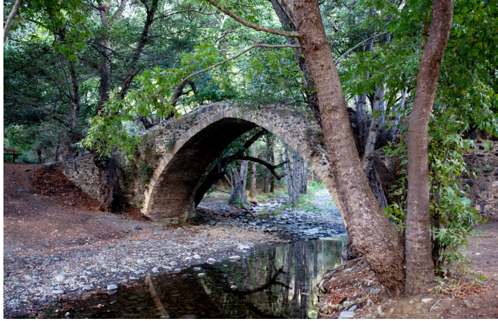
Pont de Tzelefos

Dirigez-vous ensuite vers le petit village d'Arminou, avec ses rues en colimaçon bordées de maisons de pierre. Au nord du village se trouve l'une des grandes curiosités de l'île, le pont de Tzelefos, le plus grand des ponts médiévaux en pierre enjambant la rivière Diarizos. Son aire de pique nique offre un vrai moment de bonheur au milieu de la nature.