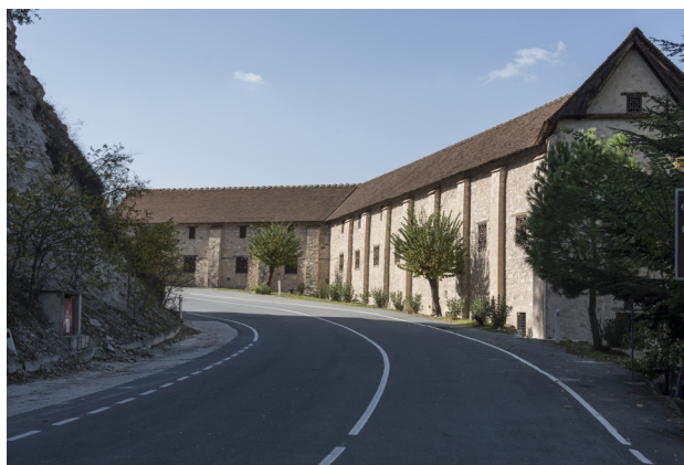
Monastère de la Panagia Chrysorrogiatissa