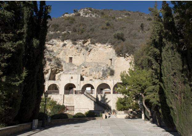
Monastère d'Agios Neofytos

Conduire lentement en entrant dans le monastère pour rejoindre le parking. Fondé par le Chypriote Neofytos, qui creusa lui-même son abri rocheux, le monastère est célèbre pour ses fresques byzantines des 12 et 15èmes siècles et son étonnante architecture. Occupé aujourd'hui par quelques moines seulement, le monastère, situé sous des grottes à quelques 400 m d'altitude, offre une vue superbe sur la côte de Pafos.